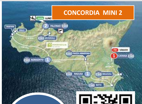
CONCORDIA MINI 2