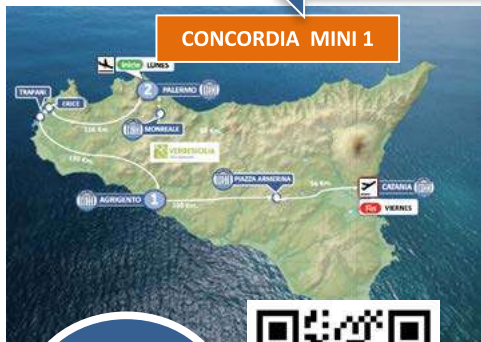
CONCORDIA MINI 1

TAMBIEN LO PUEDES FINALIZAR ANTES EN CATANIA CON 02, 01 Ó NINGUNA NOCHE