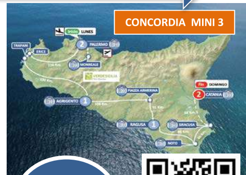
CONCORDIA MINI 3